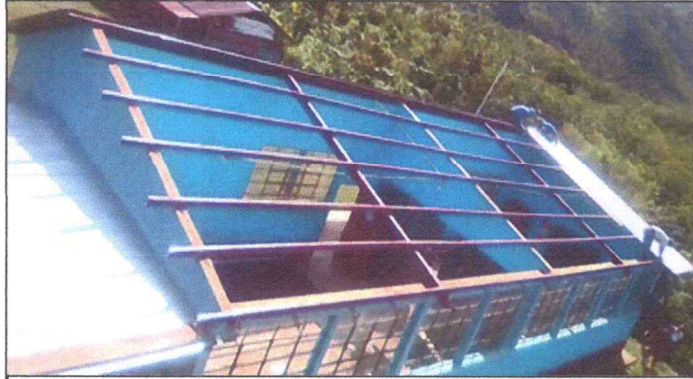
Foto1: SE ESTAN REALIZANDO LOS CAMBIOS DE TECHOS DE LAS AULAS